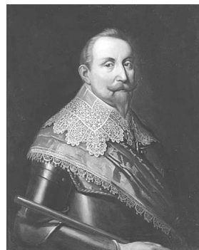
Gustaw II Adolf, król Szwecji.